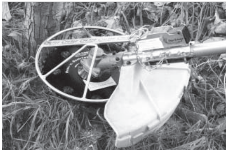
D. Ruppert, KWF

Die Einsatz-Erprobungen wurden von der Waldarbeitsschule Itzelberg und der KWF-Zentralstelle durchgeführt.