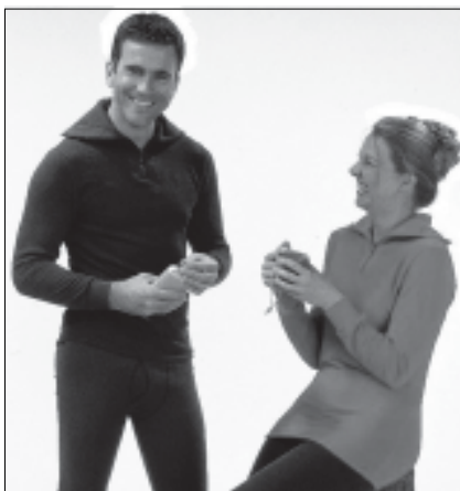
Abb. 2: Beispiel einer Funktionsunterwäsche

Es wurden insgesamt vier Produkte behandelt. Nachfolgend werden die neu FPA-erkannten Produkte aufgelistet, die allerdings z.T. mit Auflagen anerkannt worden sind. Erst wenn die Auflagen erfüllt sind, wird dem Anmelder eine Urkunde ausgestellt.