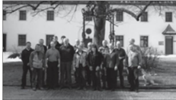
Abb. 1: Der Prüfausschuss in der Forstlichen Ausbildungsstätte Ort/Gmunden

ge im Ausschuss einnehmen. Das KWF mit seinem Ausschuss „Arbeitsschutzausrüstung“ dankt den beiden Herren für die langjährige, fruchtbare und zuverlässige Arbeit.