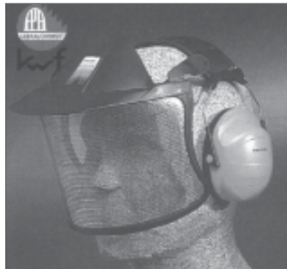
Abb. 3: Beispiel einer Gehör- und Gesichtsschutzkombination