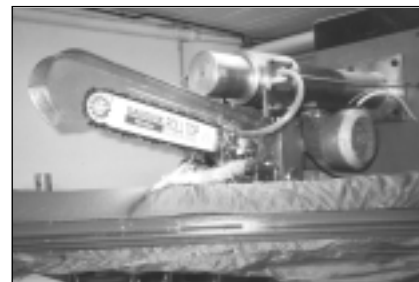
Beispiel: Prüfung von Schnittschutz in Schutzhosen

Mit Vereinheitlichung der Normen auf dem Gebiet des Schnittschutzes gegen Schnitte mit der Motorsägenkette wurde in der Praxis ein hohes Sicherheitsniveau erreicht, welches letztlich dazu geführt hat, dass die Unfallzahlen mit Verletzungen durch Schnitte im Beinbereich erheblich gesenkt werden konnten.