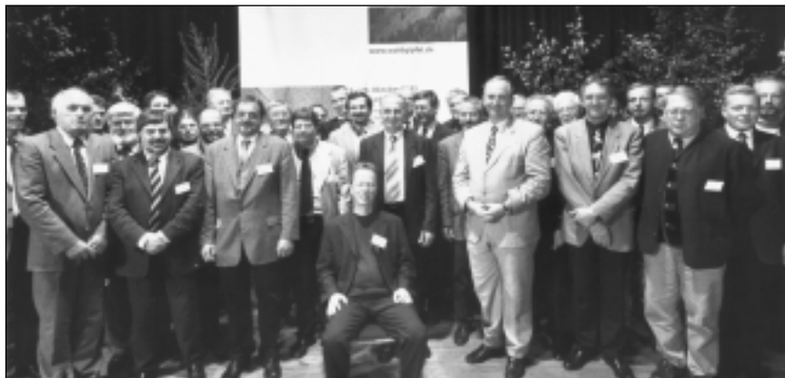
Abb. 4: „Der Gipfel ist erklommen!“ Über 35 Vertreter der Forst- und Holzwirtschaft, Politik, Industrie, Wissenschaft, von Umweltverbänden, Tourismus, Sport sowie Gewerkschaften und Berufsverbände nach der Unterzeichnung des „Vertrages“

Leistungsfähige wissenschaftliche Forschung, Lehre und Weiterbildung sind Grundlage für eine zukunftsfähige Weiterentwicklung von im umfassenden Sinne nachhaltigen Nutzungsformen und Schutzkonzepten für Wald und Landschaft, dies gilt besonders auch im internationalen Kontext. Entsprechende Forschungsvorhaben sind zu fördern, die forst- und holzwirtschaftlich ausgerichteten Lehr- und Forschungseinrichtungen sind deshalb weiterzuentwickeln und zu stärken.