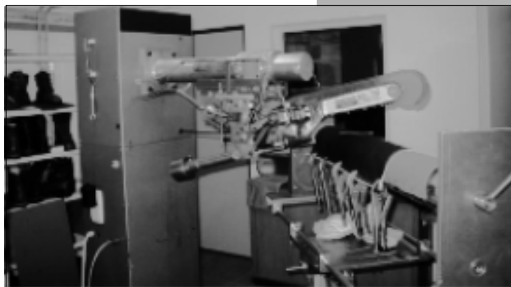
Prüfstand zur Prüfung von Kettensägen- Schnitenschutz

Damit kann festgestellt werden, dass die in den o. g. Normen festgelegten Mindestanforderungen ihr Ziel des Gesundheitsschutzes und der Sicherheit der Person voll erfüllt haben.